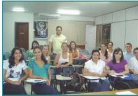
Grupo de Estudos de Farmacologia Clínica - Maringá/PR