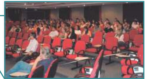
Curso de Antibióticoterapia Racional Londrina/PR