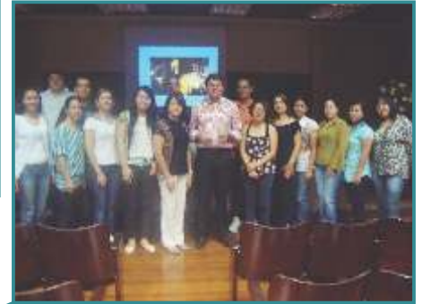
Curso de Antibióticoterapia Racional Cornélio Procópio/PR