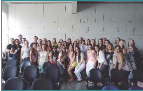
Reunião de Orientação - Cascavel/PR