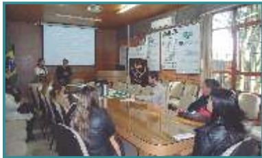
Entrega de Carteiras - Francisco Beltrão/PR