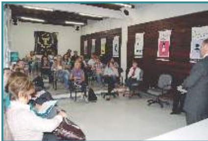
Reunião sobre Descarte de Medicamentos - Curitiba/PR