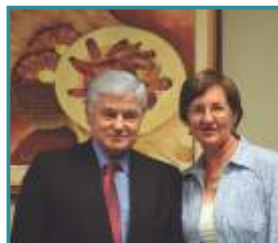
Projeto de Lei das Drugstores - Curitiba/PR

Diretoria do CRF-PR e Anfarmag se reuniram com o Prefeito de Curitiba Gustavo Fruet para discutirem a redução do imposto ISS para as Farmácias de Manipulação. Curitiba/PR.