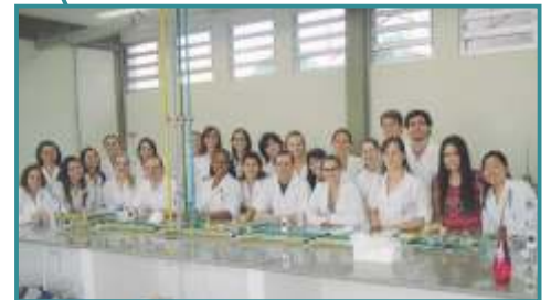
Curso aplicação de Injetáveis Londrina/PR

Paraná é o primeiro estado a exigir que farmácias de manipulação forneçam bulas detalhadas com seus medicamentos. O CRF-PR através da comissão de Manipulação e a Anfarmag PR, não mediram esforços para tornar realidade esse projeto. A população é a maior beneficiada - Curitiba/PR