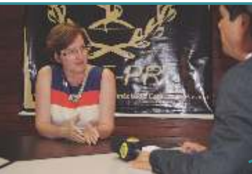
Entrevista Manipulados - BAND TV