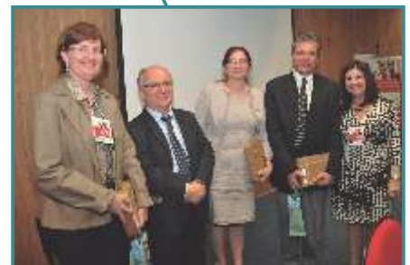
Encontro sobre Acreditação em serviços de Saúde - Londrina/PR