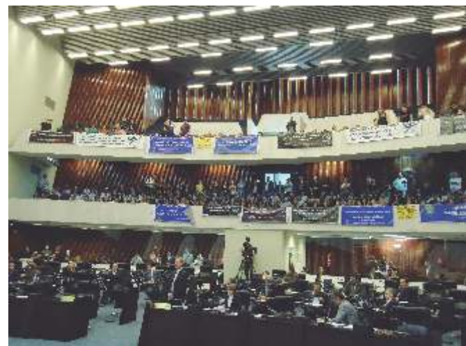
Manifestação em Curitiba - 08/08/2013

O CRF-PR apoiou as manifestações em todo o Paraná e esteve presente junto com o CFF no Congresso Nacional nas Votações dos Vetos (último dia 20/08/2013).