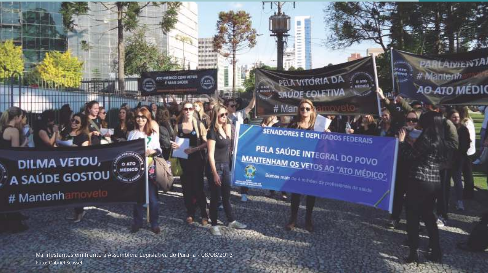
Manifestantes em frente à Assembleia Legislativa do Paraná - 08/08/2013